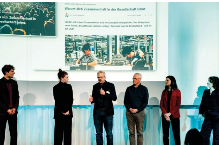
Vorstellung der Studie beim Roman Herzog Institut in München.

Eine internationale Vergleichsstudie mit Daten aus 171 Ländern zeigt einen engen Zusammenhang