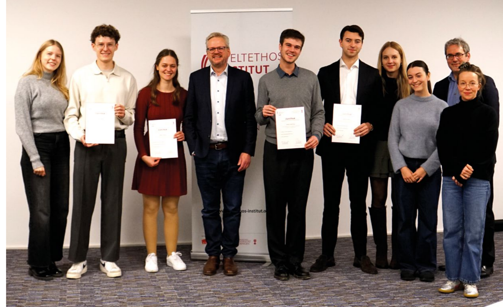
Zertifikatsabsolvent*innen freuten sich über die Anerkennung und den Austausch.

Beim anschließenden Austausch wurde deutlich: Das Interesse an wertebasierter Orientierung ist groß – und der Wunsch, Verantwortung zu übernehmen, ebenso.