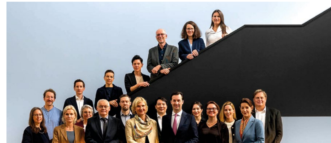
Das Team der Karl Schlecht Stiftung (KSG).