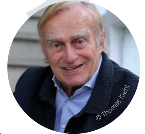
Prof. Dr. rer. pol. Helmut Haussmann Bundeswirtschaftsminister a.D.

Als junger Student an der Universität Tübingen hat mich der Aufbruchgeist geprägt, den mein Lehrer Ralf Dahrendorf und sein Freund Hans Küng verkörperten. Beiden ging es um Lebenschancen in einer freiheitlichen Ordnung – und um eine Wirtschaft, die Wettbewerb und Ausgleich, Wohlstand und Gemeinwohl verbindet. Heute steht die Soziale Marktwirtschaft unter großem Druck. Da sind Orte wichtig, die Orientierung geben und den Dialog zwischen Wirtschaft, Ethik und Gesellschaft ermöglichen . Das Weltethos-Institut tut genau das – anständig, klug und mit Weitblick. Gut, dass es an Profil und Sichtbarkeit gewinnt.