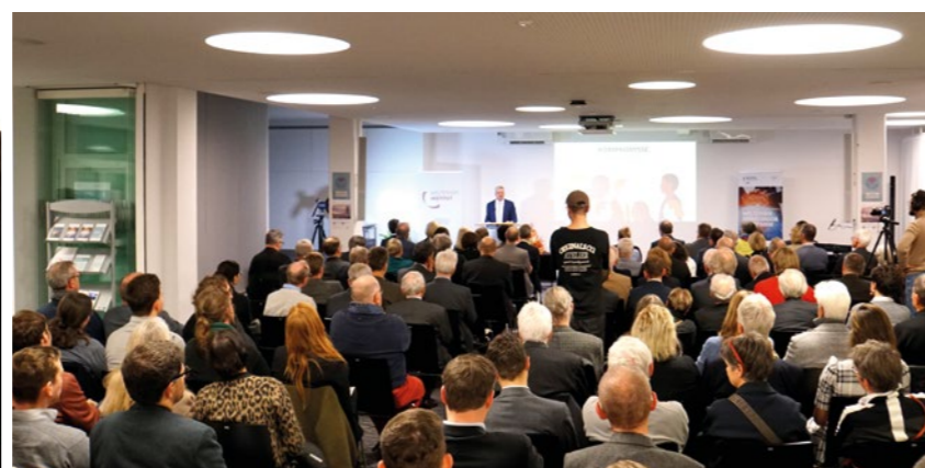
Volles Haus bei der Antrittsvorlesung