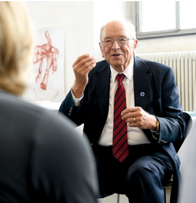
Stifter Karl Schlecht.

Die Leitidee der Stiftung ist „GOOD LEADERSHIP“: Die Vision von guter, zukunftsfähiger Führung stellt den Menschen auf Basis von humanistischen Werten in den Fokus.